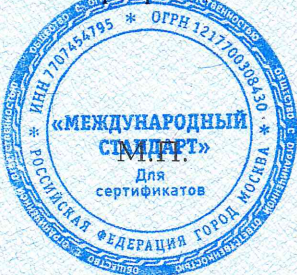
Схема сертификации: 3с.